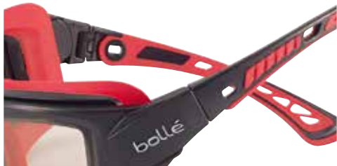
傾き調整可能テンブル

※1 高温・高気圧下での滅菌処理の事。通常この処理でコーティング効果は消失すると言われています。